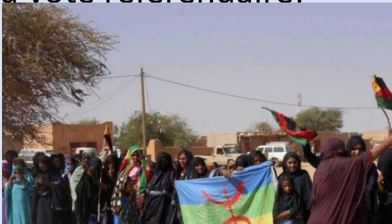
Mai 2014 Kidal