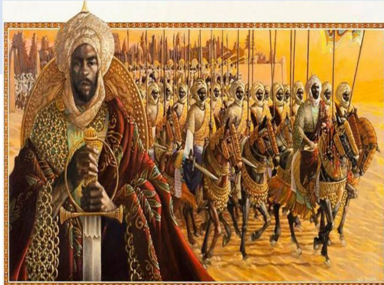
Kankou Moussa Keita, considéré comme l'homme le plus riche du monde est le 10eme empereur du Mali. Né en 1280 au Mali, Il est petit neveu de Soundjata Keita et règne pdt 25 ans jusqu'à sa mort en 1337