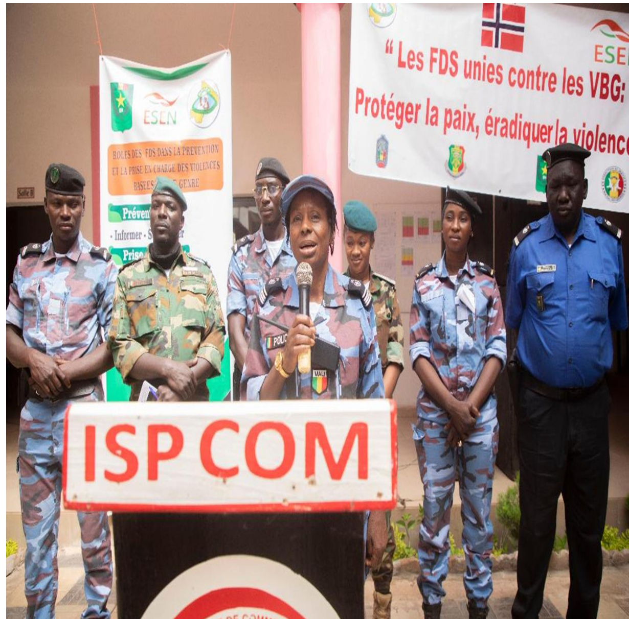
Illustration de collaboration avec les Forces de Défense et de Sécurité au Mali pour la Prévention et la Prise en Charge des VBG au Mali: