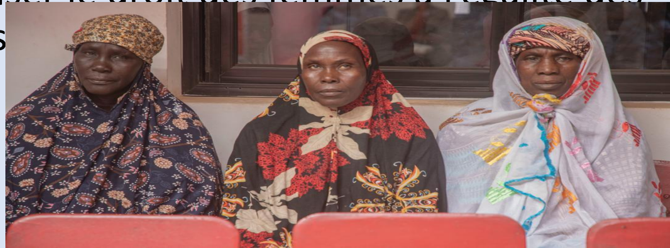
Femmes d'un village sous embargo dans le centre du Mali

Sanctuariser certains droits des femmes : idée d'imposer un régime de sanctions régionales aux pays violant leurs engagements en faveur de l'égalité des sexes; constitutionaliser le droit des femmes à l'égalité des sexes et à la protection contre les VBG/VSLC;