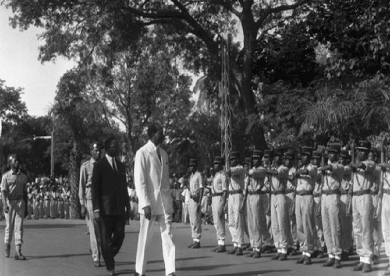
Le Président Modibo Keita passant en revue les troupes de l'Armée Malienne (1962)